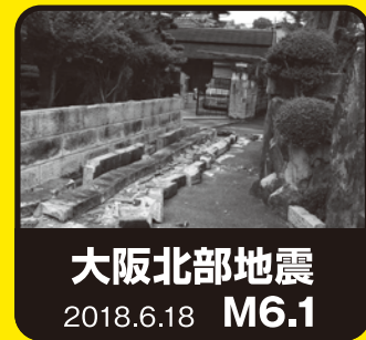
大阪北部地震 2018.6.18 M6.1